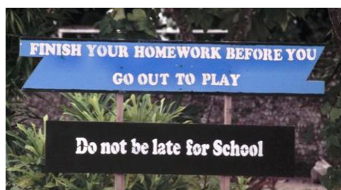
Letreros en la puerta de una escuela primaria en el atolón de Rasdhoo (Islas Maldivas)