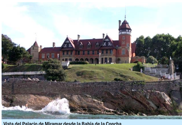
Vista del Palacio de Miramar desde la Bahía de la Concha

Estas han sido las líneas maestras que nos han guiado para la Organización de este Congreso, esperamos haber respondido a las expectativas.