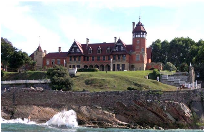
Vista del Palacio de Miramar desde la Bahía de la Concha

http://www.sc.ehu.es/sfwseec/con2006.htm